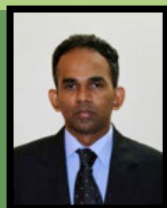
N ヨガタス 取締役